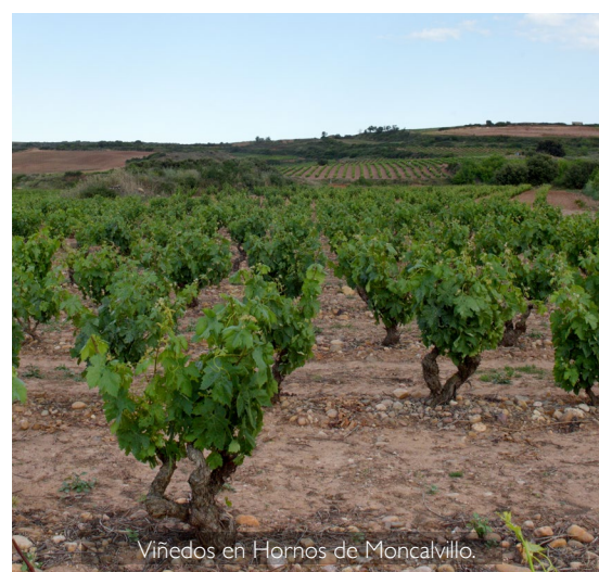
Viñedos en Hornos de Moncalvillo.